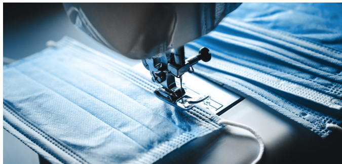
Od siječnja 2020. u naše smo objekte poslali gotovo 1.600.000 maski za lice!

tim je također pomogao uspostaviti drugo distribucijsko mjesto u našem objektu LPT u Prelogu, Hrvatska. Taj distribucijski centar ispunjava narudžbe za opskrbu europskih lokacija tvrtke L&P.