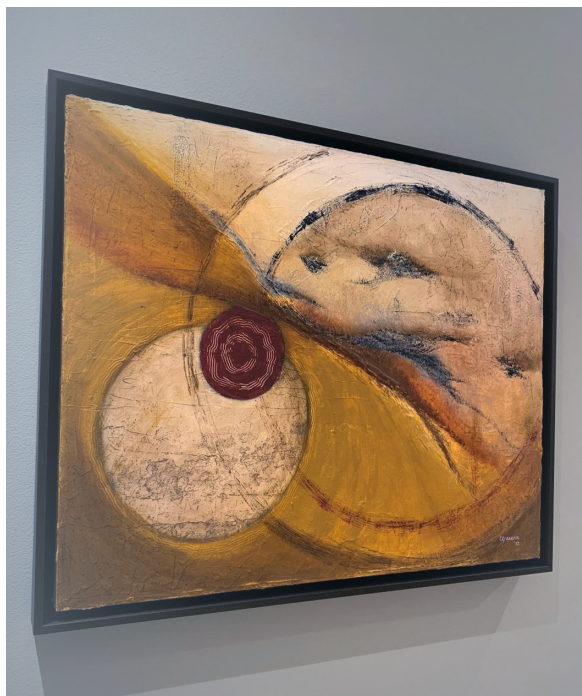
Jedno od Aninih umjetničkih djela, „Krugovi ljubavi“, akril na platnu.

Kao kupac programa radim s novim automobilskim programom od samog početka do lansiranja za proizvodnju. Obrađujem zahtjeve za prijedlozima, pratim ponude i osiguravam da su planovi nabave aktualni kako bi naši programi s proizvođačima automobila bili uspješni.