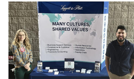
Članovi L&P tima iz Peterson Chemical Technology i odjel za akviziciju talenata na regrutacijskom događaju.

Naš TA tim oprema menadžere za zapošljavanje alatom koji će im pomoći u održavanju osobnog pristupa tijekom zapošljavanja. Do sada je TA tim obučio 250 menadžera za zapošljavanje u Sjevernoj Americi i Europi, s planovima za uvođenje alata u Aziji i Pacifiku kasnije ove godine.